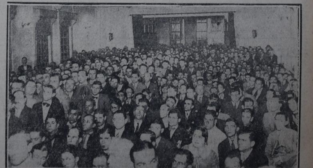
ASPECTO DEL SALON DURANTE EL ACTO DE ANOCHE

mente, luego, de las leyes obreras, especialmente la de ocho horas y la de descanso dominical.